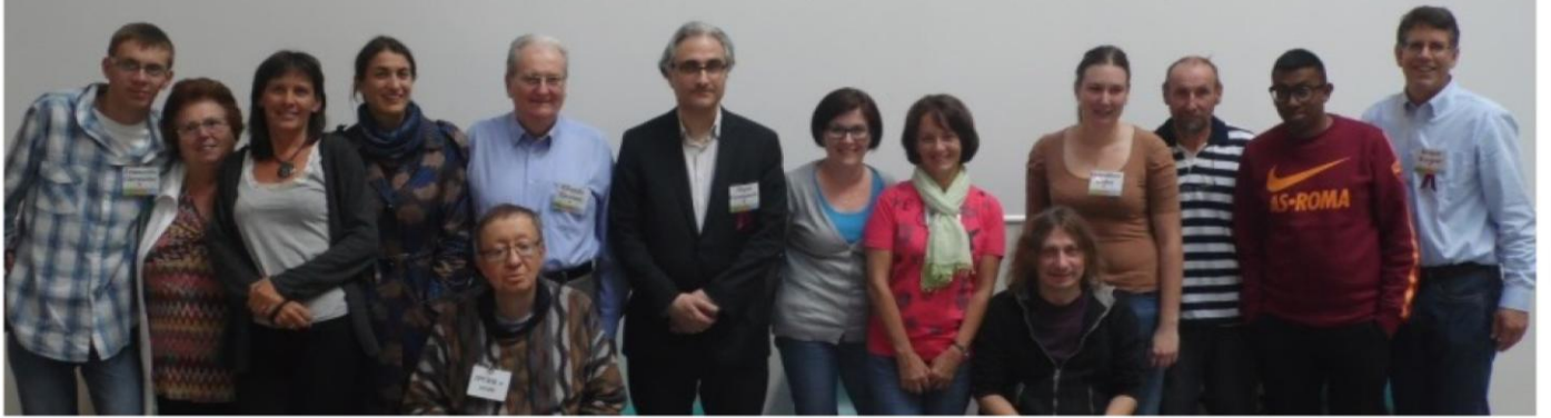
TESTS SUR LA DOULEUR A L'INSTITUT IMAGINE - NECKER LE 11/10/2014

18 PC'ers françaises, avec la mutation K6a, ont participé au 1 er test mondial sur la douleur effectué sur les personnes atteintes de Pachyonychie Congénitale à Paris au centre Imagine de l'hôpital Necker